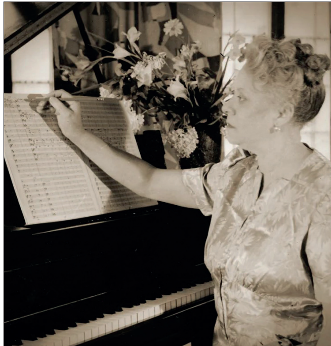
“Naxos lleva años construyendo, con paciencia y criterio, un amplio catálogo discográfico dedicado a la compositora afroamericana Florence Beatrice Price”.

El álbum coral está protagonizado por Abraham Lincoln Walks at Midnight , primera grabación mundial de la obra más ambiciosa que Florence B. Price compuso para coro